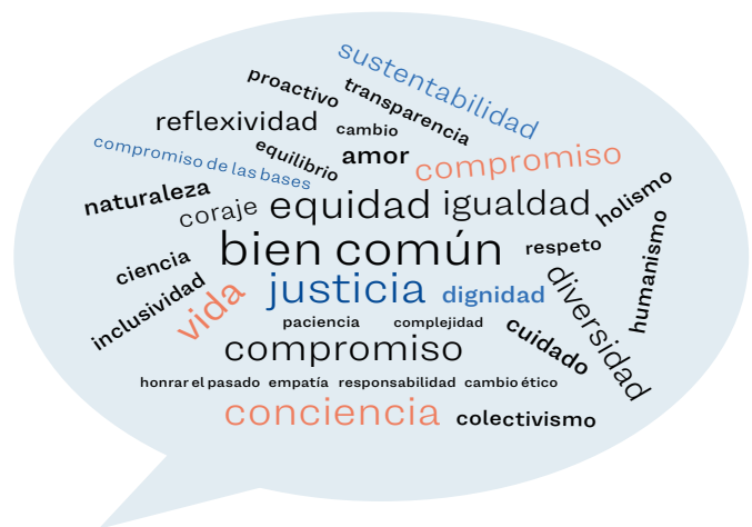
Fuente: Nube de palabras creada con los aportes recibidos por los participantes de Transformación 2019.

Una de las palancas o impulsores más importante para lograr cambios en los sistemas se relaciona con los valores y cosmovisiones que guían las transformaciones. Un ejercicio durante la Conferencia de Transformación 2019 solicitó a los participantes que respondieran a la pregunta: ¿Qué es lo más importante que un responsable de políticas debiera saber sobre la transformación? De las respuestas recibidas, el 31% mencionaron valores que deberían guiar las transformaciones. Estos son los valores mencionados, mostrados en mayor tamaño según su orden de prioridad.